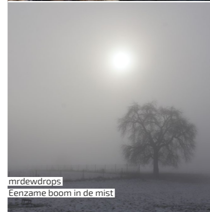
mrdeudrops Eenzame boom in de mist