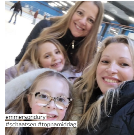
emmersondury #schaatsen #topnamiddag