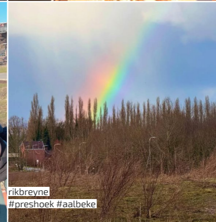
rikbreyne #preshoek #aalbeke