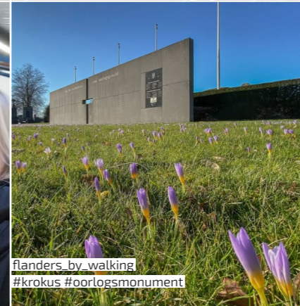
flanders_by_walking #krokus #oorlogsmonument