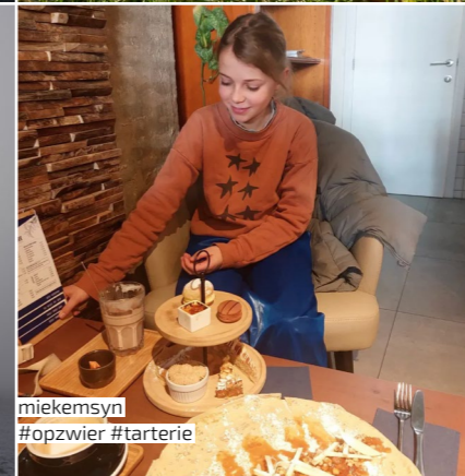
miekemsyn #opzwier #tarterie