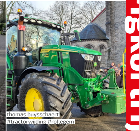
thomas.buyschaert #tractorwijding #rollegem