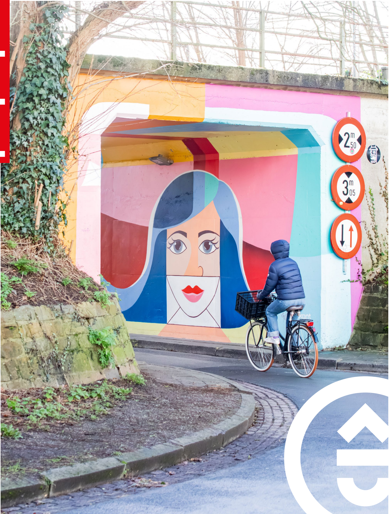
Het lentezonnetje loert om de hoek.