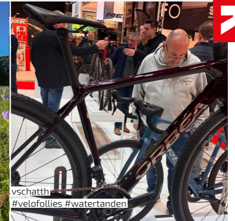
vschatth #velofollies #watertanden