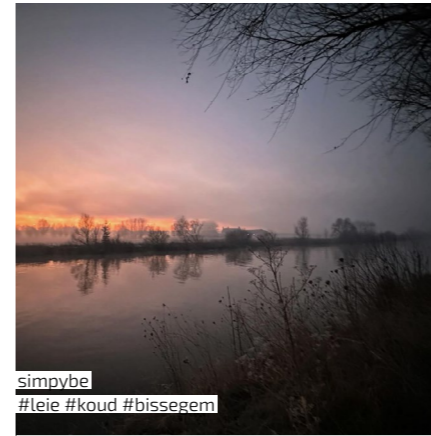
simpybe #leie #koud #bissegem