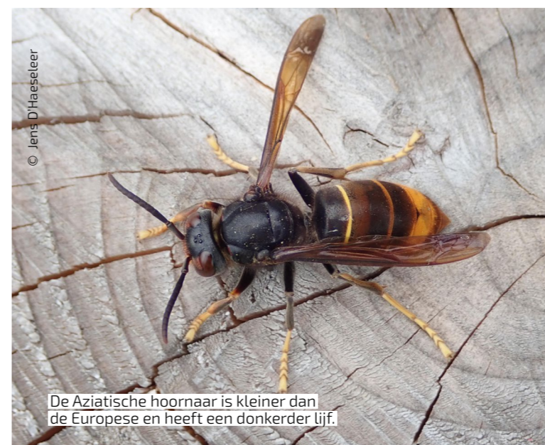
De Aziatische hoornaar is kleiner dan de Europese en heeft een donkerder lijf.