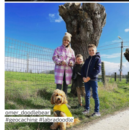
omer_doodlebear #geocaching #labradoodle