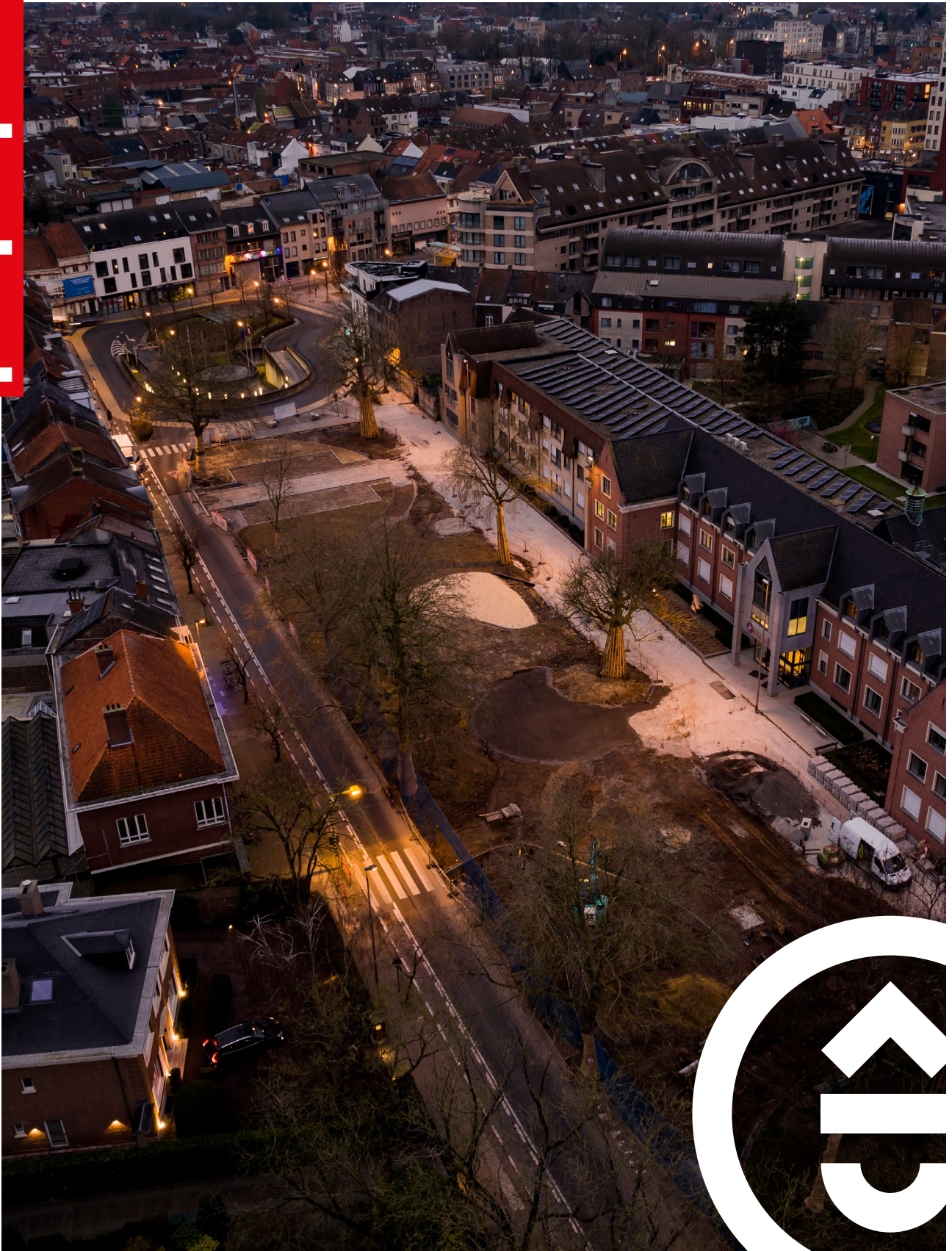
De contouren van het Groeningepark worden stilaan zichtbaar.