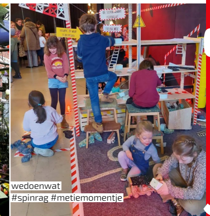
wedoenwat #spinrag #metiemomentje