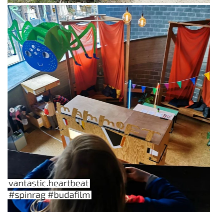
vantastic.heartbeat #spinrag #budafilm