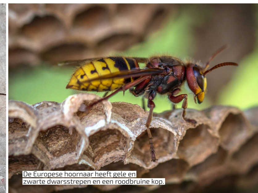
De Europese hoornaar heeft gele en zwarte dwarsstrepen en een roodbruine kop.