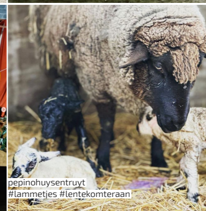
pepinohuysentruyt #lammetjes #lentekomteraan