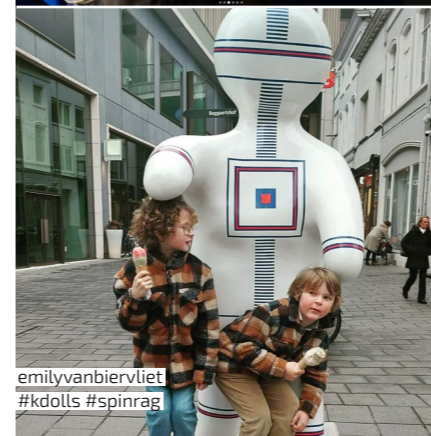
emilyvanbiervliet #kdolls #spinrag