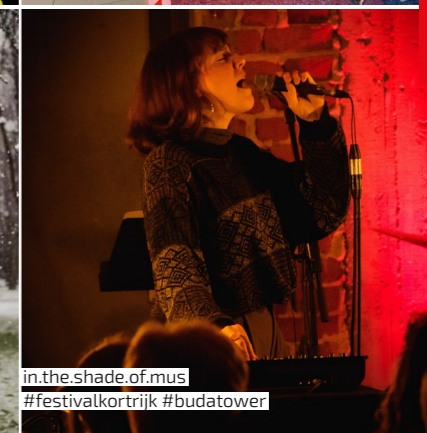
in.the.shade.of.mus #festivalkortrijk #budatower