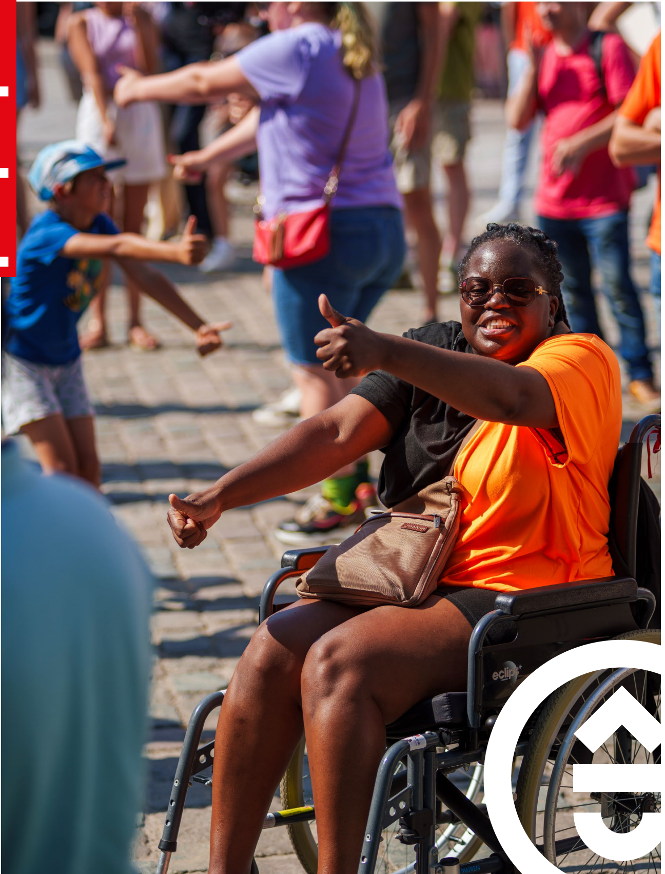
Niets dan blije gezichten tijdens de Leiefeesten.