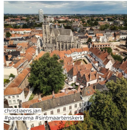
christiaens.jan #panorama #sintmaartenskerk