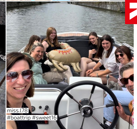
miss.l78 #boattrip #sweet16