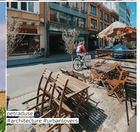
petraduse #architecture #urbanlovers