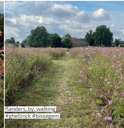
flanders_by_walking #ghellinck #bissegem