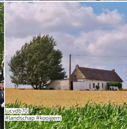
lucvdb70 #landschap #kooigem