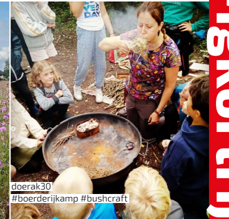
doerak30 #boerderijkamp #bushcraft