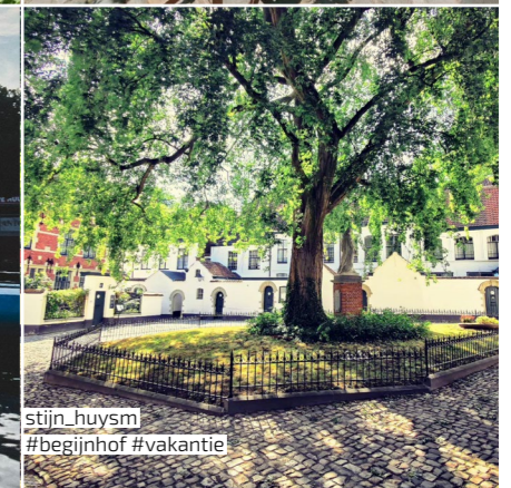
stijn_huysm #begijnhof #vakantie