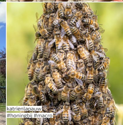
katrienlapauw #honingbij #macro