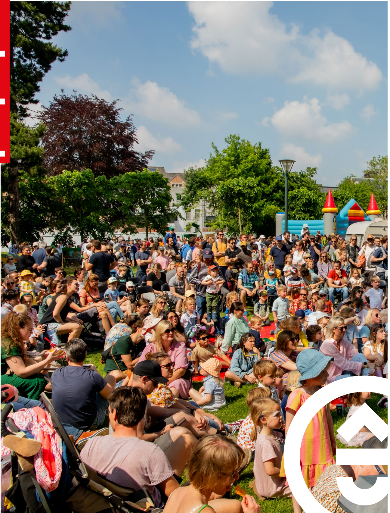
Sinksen kreeg dit jaar een recordaantal bezoekers over de vloer.