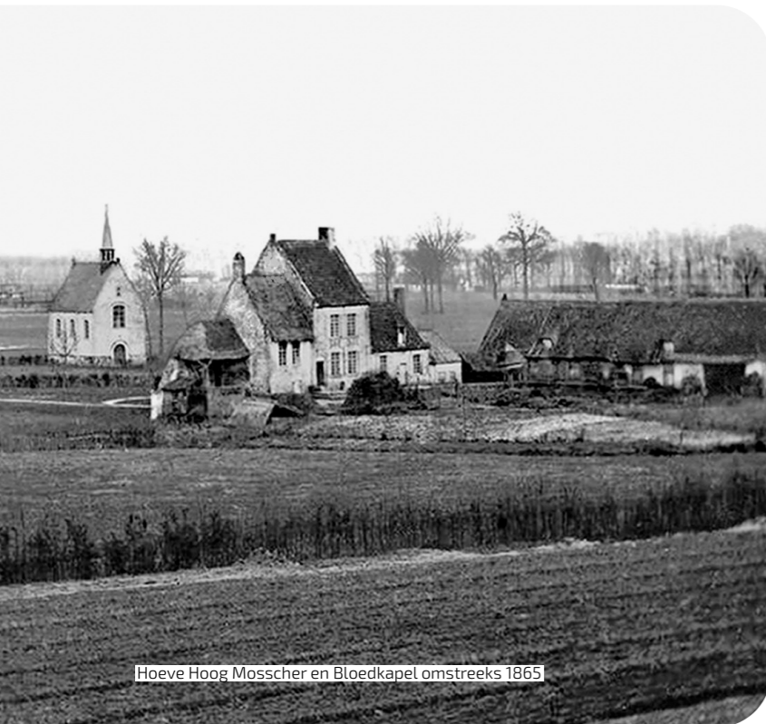
Hoeve Hoog Mosscher en Bloedkapel omstreeks 1865