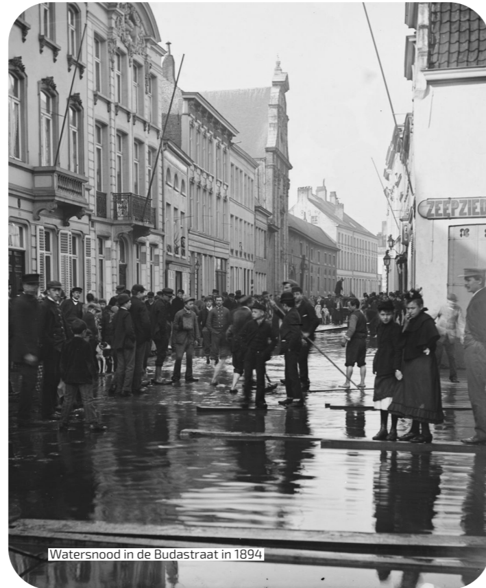
Watersnood in de Budastraat in 1894

Net zoals Budapest kent ook het Buda-eiland een rijke geschiedenis. Vóór de introductie van de naam Buda heette deze wijk Pamele. De Budastraat was dan weer gewoon de Leiestraat. Je vond er herbergen, bakkers, slagers, brouwerijen, een drukkerij, een tabakswinkel ... Maar Buda kende ook veel tegenspoed. Tijdens de overstroming van de Leie in 1894 stond de Budastraat onder water. En tijdens de oorlogen was er veel schade door het opblazen van de bruggen.