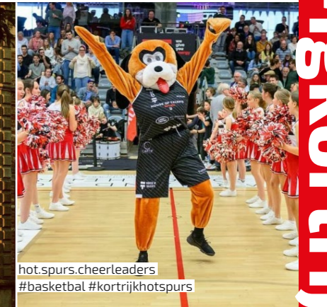
hot.spurs.cheerleaders #basketbal #kortrijkhotspurs