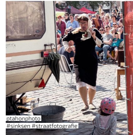
ptahonphoto #sinksen #straatfotografie

In 1944 werden de hoeve en de achterliggende Bloedkapel vernield tijdens de bombardementen. Later werd het goed heropgebouwd tot wat nu het Kasteel van Hoog Mosscher is. In de straat Hoog Mosscher vind je al meer dan een eeuw sociale en assistentiewoningen. Het Van Ackershof was een van de eerste projecten in 1913.