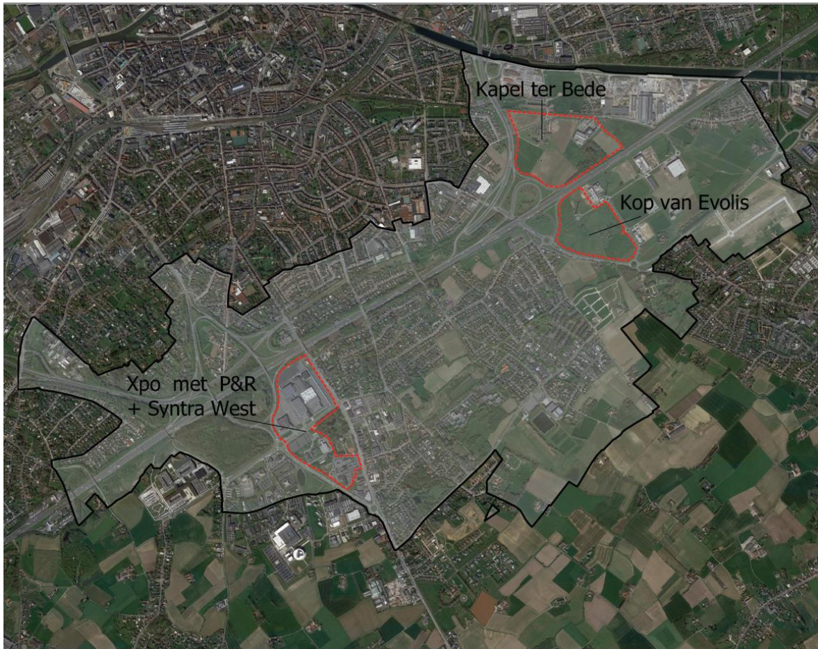
Figuur 2: Weerhouden locatiealternatieven t.a.v. contour GRUP K-R8

In het verder verloop van het planproces zullen de mogelijkheden en planopties van de locatiealternatieven afgewogen worden gedurende de verdere afstemming van beide planprocessen.