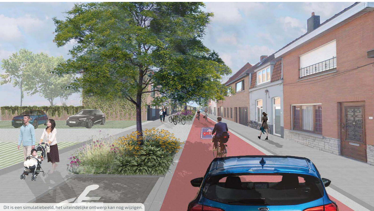
Dit is een simulatiebeeld, het uiteindelijke ontwerp kan nog wijzigen.