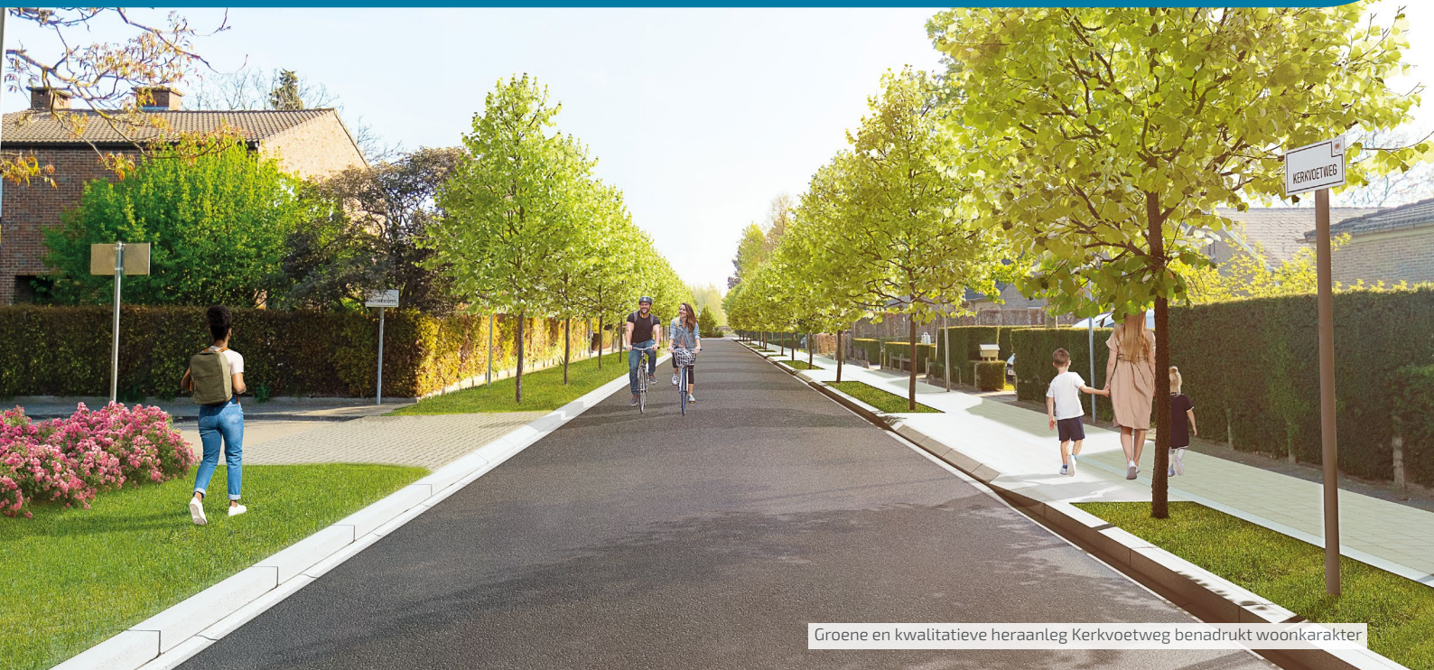
Groene en kwalitatieve heraanleg Kerkvoetweg benadrukt woonkarakter